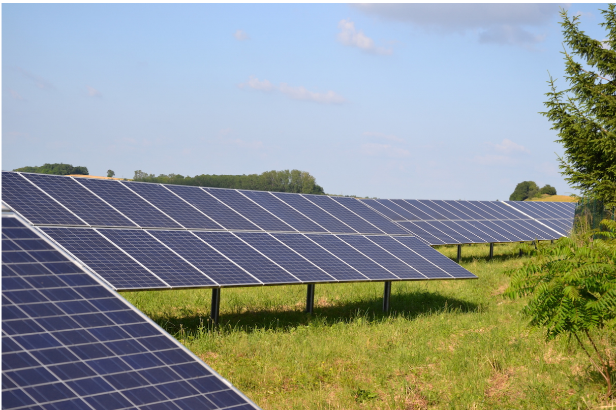
Der 2014 finanzierte Solarpark Langenbogen bei Halle in Sachsen-Anhalt

Die Sonneninvest AG mit Sitz in Wien hat bereits drei erfolgreiche Crowdfunding-Runden für bestehende Solarparks in Deutschland bei Econeers durchgeführt. 2014 wurde der Solarpark Langenbogen in Sachsen-Anhalt von 322 Investoren mit 442.750 Euro refinanziert – zu diesem Zeitpunkt das größte deutsche Crowdfunding-Projekt im Bereich Photovoltaik. Beim zweiten Crowdfunding-Projekt Sonneninvest Deutschland konnten die Solarparkbetreiber sogar eine Summe von 759.250 Euro von 482 Econeers-Investoren einsammeln. Es wurde ein Portfolio bestehend aus drei EEG-geförderten Solarkraftwerken refinanziert, die jährlich rund 1,65 Millionen Kilowattstunden Strom liefern. Die Crowd-Investoren erhalten für ihr Investment in Abhängigkeit von der Zahl der eingespeisten Kilowattstunden eine jährliche Verzinsung in Höhe von 4,5 bis 5 Prozent. Mit dem dritten Crowdfunding im Jahr 2016 wurde ein Portfolio aus 5 bestehenden Solarparks refinanziert. Die Sonneninvest AG konnte bei diesem Funding 559 Investoren begeistern und 1.019.000 Euro Kapital mit der Crowd einsammeln.